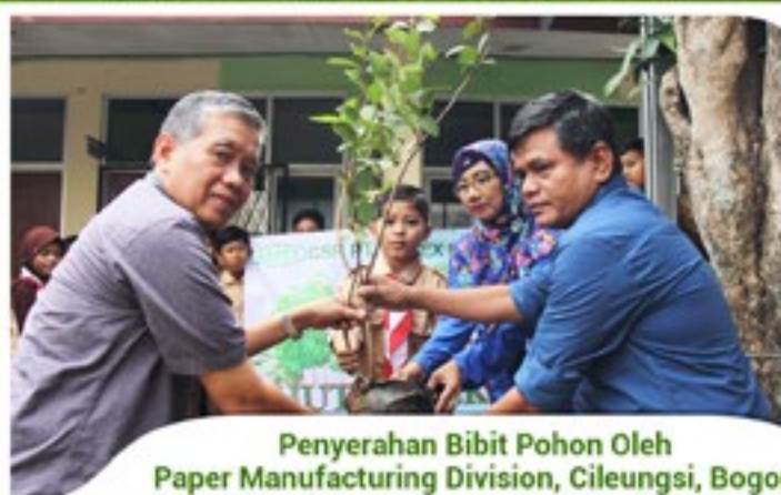
Penyerahan Bibit Pohon Oleh Paper Manufacturing Division, Cileungsi, Bogor