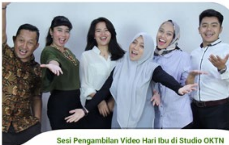
Sesi Pengambilan Video Hari Ibu di Studio OKTN