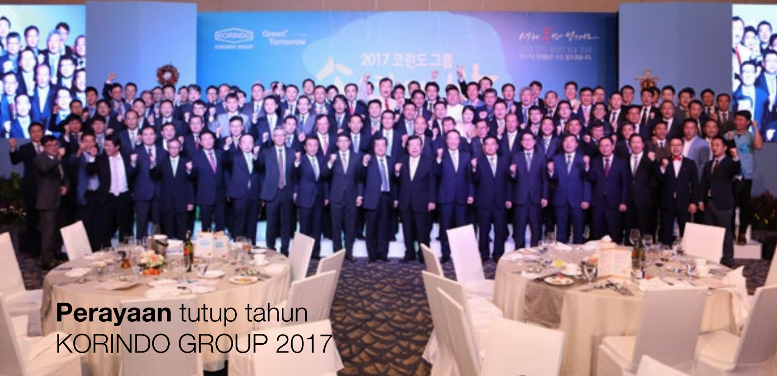
Perayaan tutup tahun KORINDO GROUP 2017