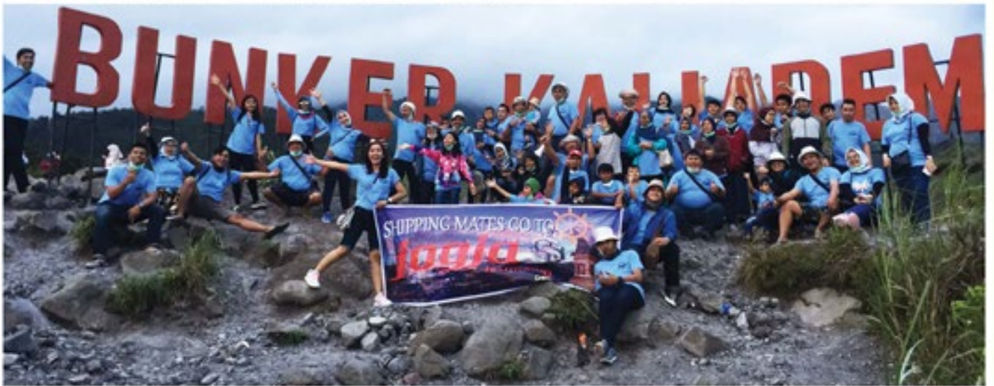
Suasana Kebersamaan Tim Meritz KORINDO Insurance